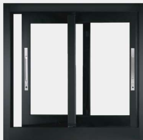
商品型號:GHCE616 測試尺寸:寬1230x高1020(mm)(二拉窗)

E系列產品使用等壓原理的設計概念 利用導流孔快速引導氣流 有效降低室內外的壓力差。