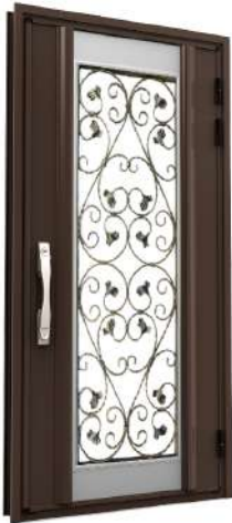
EF01 消光咖啡+鋼珠艶消