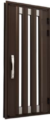
EM03 消光咖啡+金萱玻璃