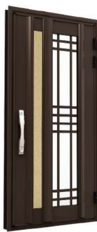
EG02 消光咖啡+金萱玻璃