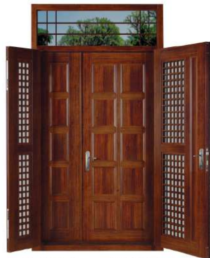
內門型式119+紗門型式605