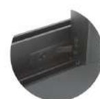
兒童防墜落安全鎖