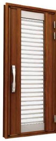
EG01 RD202日本柚木+鋼珠艶消