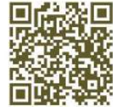
掃碼了解等壓原理