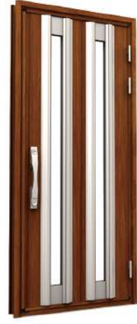
EM04 RD202日本柚木+鋼珠艶消